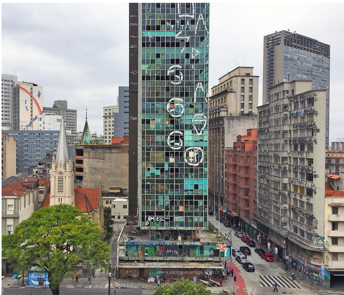
Edifício Wilton Paes de Almeida, São Paulo