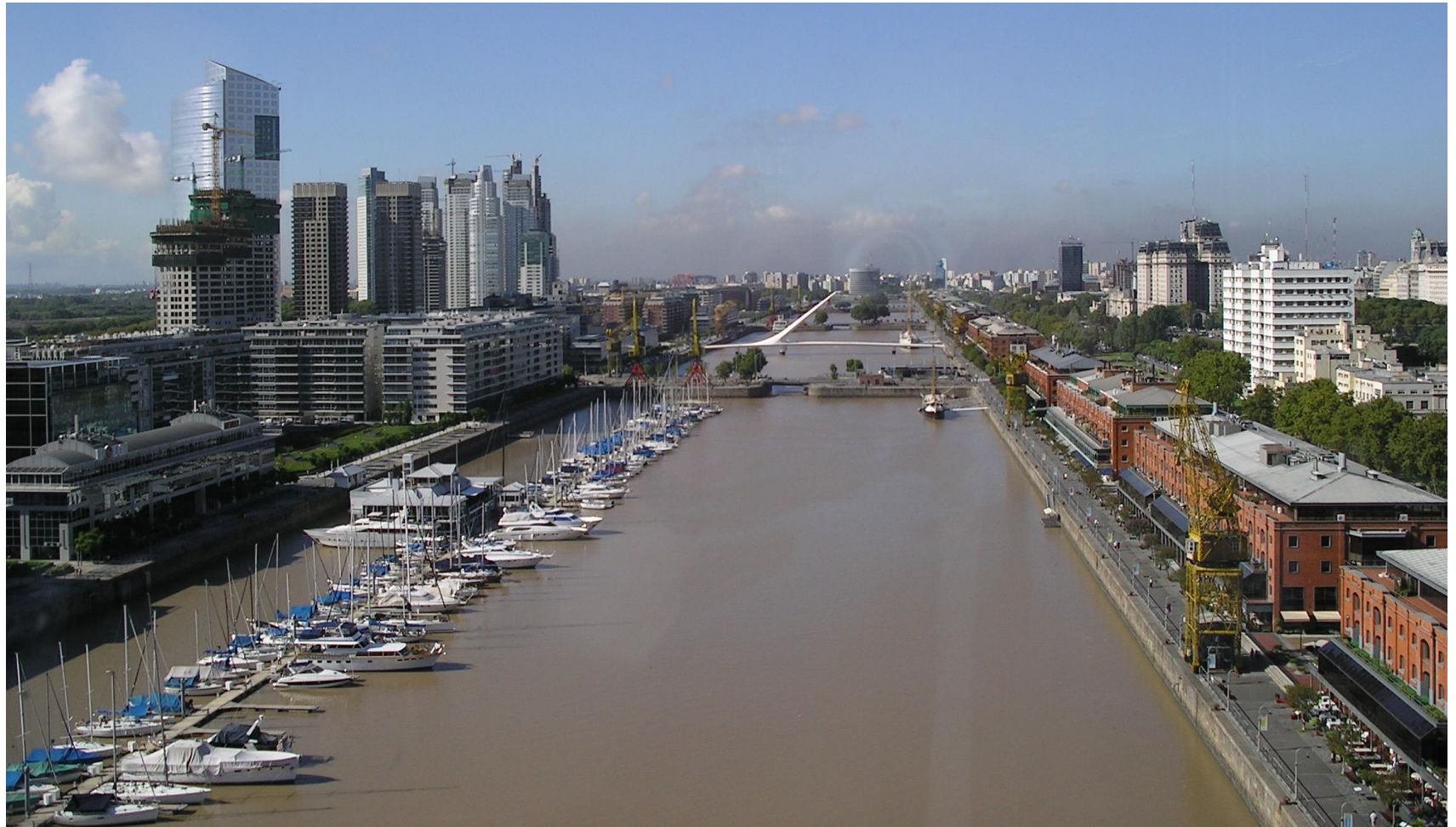
Fonte: Puerto Madero, Buenos Aires, Argentina