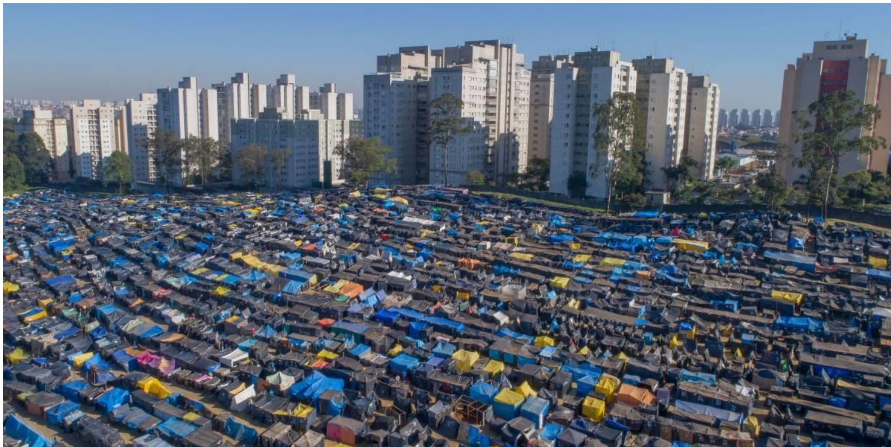
Ocupação em São Bernardo do Campo

Busca por soluções pacíficas que respeitem os direitos humanos nos conflitos fundiários urbanos