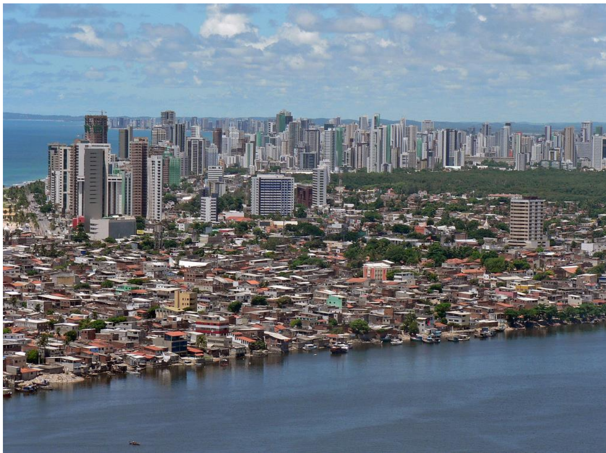
Brasília Teimosa, Recife

Habitação é tratada de forma estratégica, no centro da agenda urbana